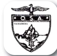
Organizzazione Sportiva Alpinisti Valmadrera