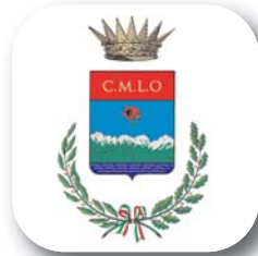
Comunità Montana Lario Orientale Valle San Martino